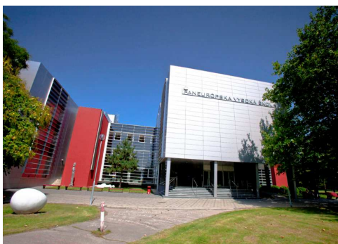
PEVŠ, Tomášikova 20, Bratislava

FAKULTA PSYCHOLÓGIE, PANEURÓPSKA VYSOKÁ ŠKOLA (PEVŠ) TOMÁŠIKOVA 20, BRATISLAVA https://www.paneurouni.com/fakulta-psychologie/