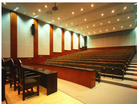
PEVŠ, Aula Maxima